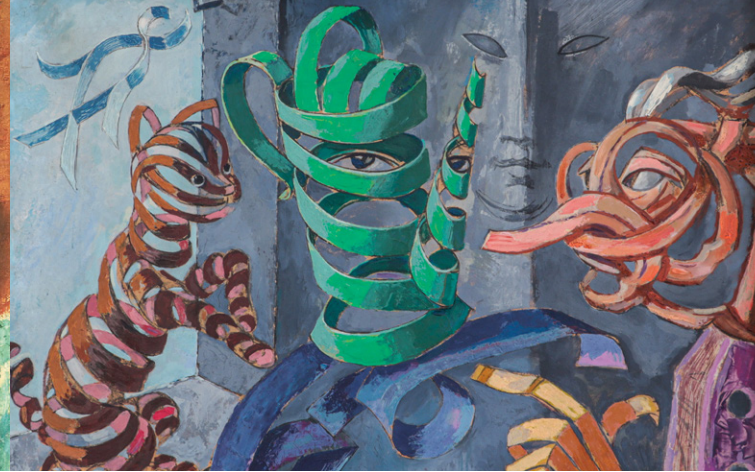
Theodor HERZMANSKY, Ein kompliziertes Gespräch (Ausschnitt), 1969, Privatbesitz