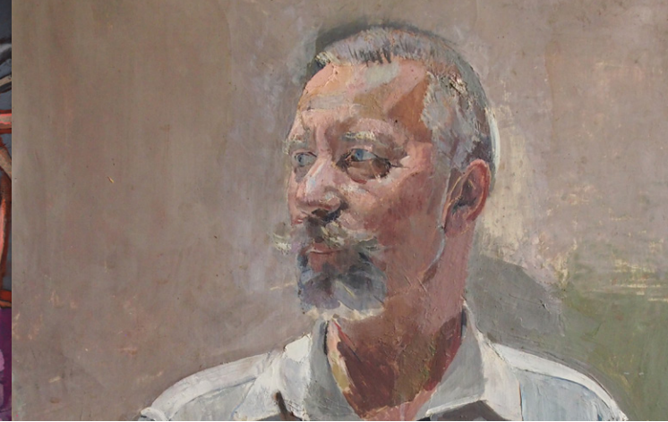
Franz WIEGELE, Porträt General Otto Herzmansky (Ausschnitt), 1928, Privatbesitz